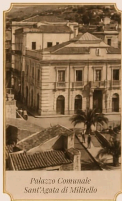
Palazzo Comunale Sant'Agata di Militello